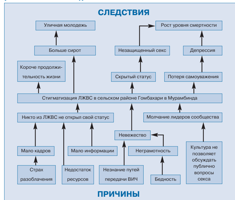
Диаграмма причин и следствий, составленная группой, работающей на местном уровне